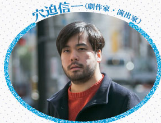
穴迫信一 (劇作家・演出家)