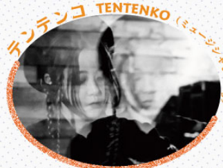
テンテンコ TENTENKO (ミュージシャン・DJ)